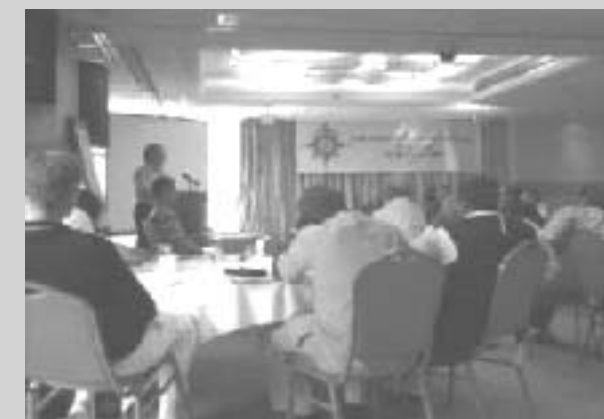
Plenária da Conferência

A Conferência TEAM, realizada em março passado na África do Sul, é outro destaque da agenda, especialmente pelas implicações dentro de cada Província da Comunhão, com o fortalecimento das ações no campo do serviço ao mundo. A exemplo do Brasil, que realizará no próximo mês de setembro uma Consulta sobre Pastorais Sociais em parceria com ERD (Episcopal Relief Development), muitas outras Províncias implementaram políticas mais eficazes no enfrentamento das questões de justiça social,